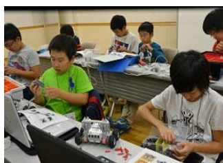
初心者向けコース