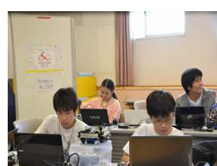
チームごとに活動