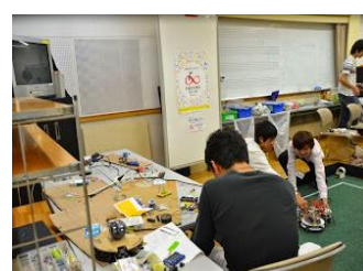
サッカーロボットの調整