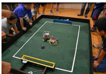
ロボットサッカーの試合

http://npo-nest.blogspot.jp/2014/10/2014.html (URL)